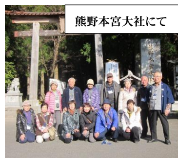
熊野本宮大社にて

熊野那智大社 は、かつては那智神社、熊野夫須美神社、熊野那智神社などと名乗っていた。また、熊野十二所権現や十三所権現、那智山権現ともいわれた。権現とは、日本の神々を仏教の仏が仮の姿で現れたものとする本地垂迹思想による神号である。仏が「仮に」神の形を取って「現れた」ことを示す思想である。大社は、現在は山の上に社殿があるが、元是那智滝に社殿があり滝の神を祀ったものだと考えられている。那智の滝は「一の滝」で、その上流の滝と合わせて那智四十八滝があり、熊野修験の修行地となっている。