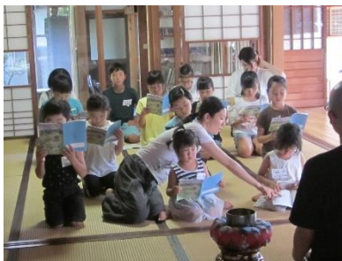
こども禅のつどい