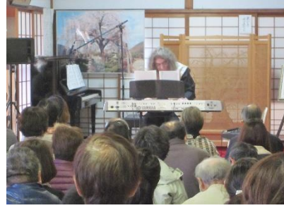
しだれ桜コンサート